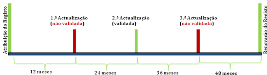
Figura 3 - Cronograma do ciclo de renovação com derrogação – 3.ª derrogação